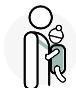
Soins de mineurs

gt grupo de trabajo sobre tratamientos del VIH ENTIDAD DECLARADA DE UTILIDAD PÚBLICA ONG DE DESARROLLO