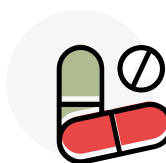
Quelques médicaments et maladies