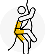
Activités de risque