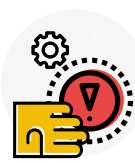
Travail de précision